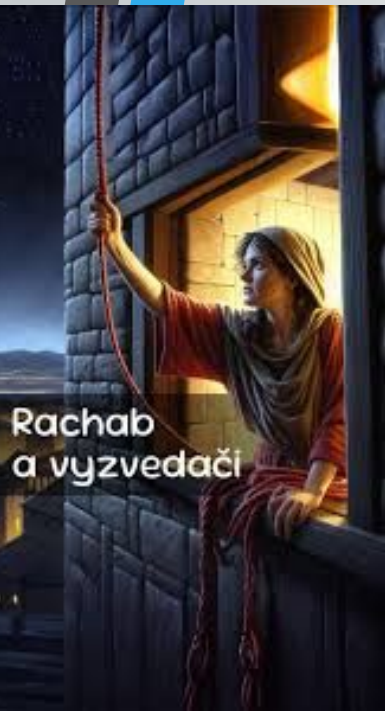
Rachab a vyzvedací